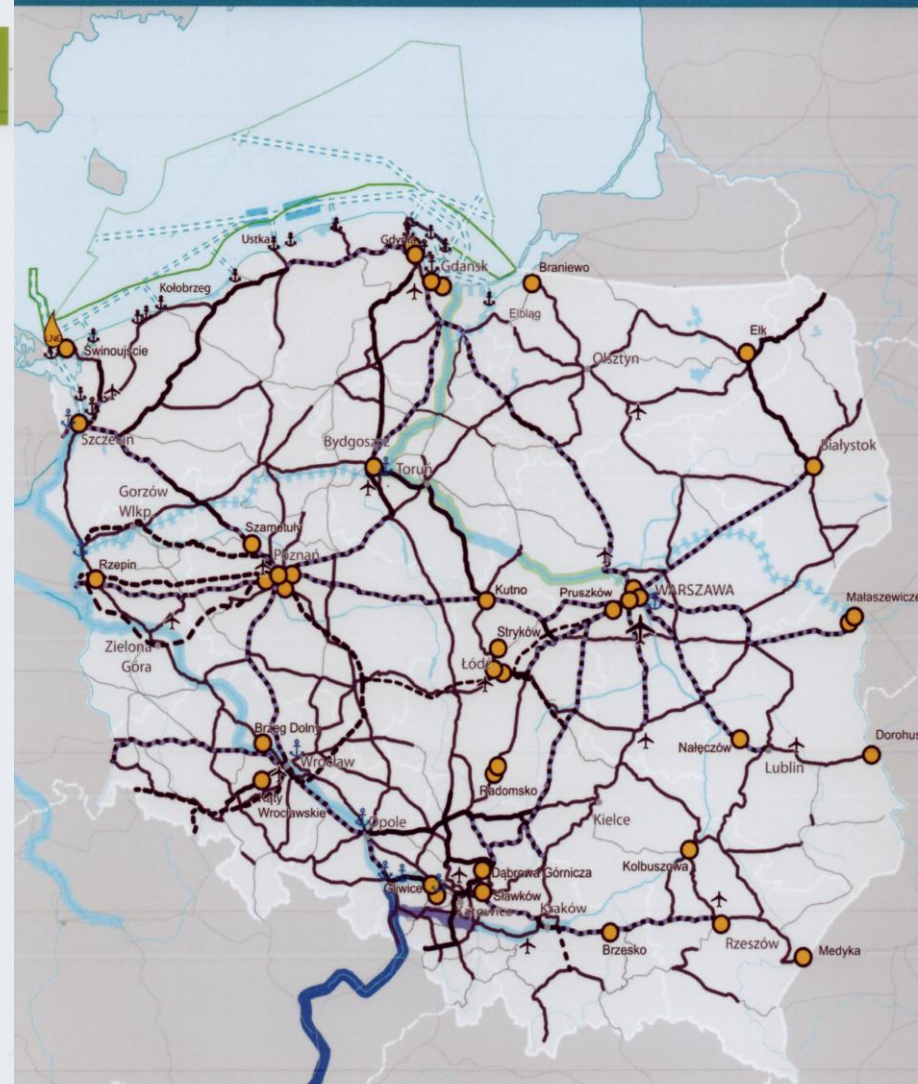
Rysunek 17. Sieć kolejowa 2030, lotniska, porty i drogi wodne