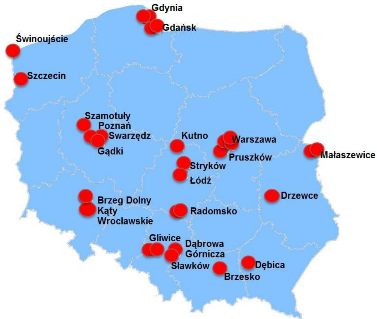
Rozmieszczenie terminali intermodalnych w Polsce wg. danych UTK